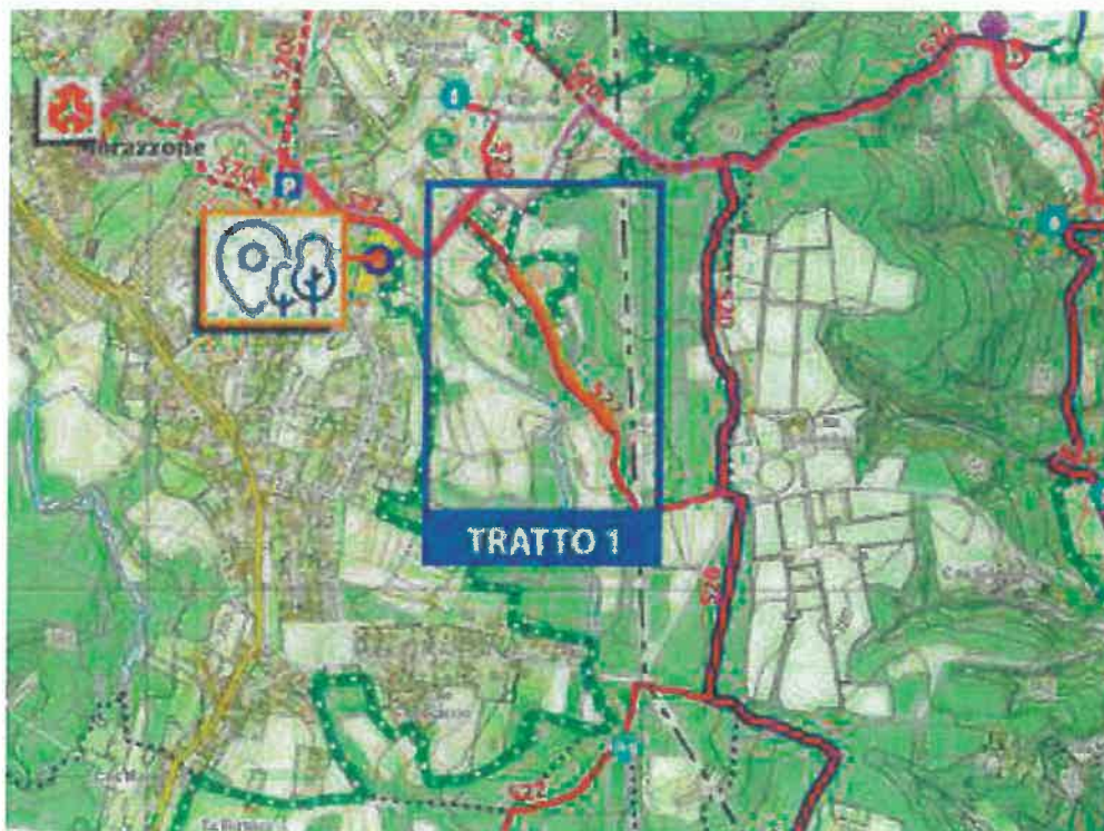
La figura indica il tratto di percorso ciclopedonale da riqualificare

Dopo aver eseguito la mappatura dei sentieri di interesse storico naturalistico presenti sul territorio comunale (vedi immagine sotto), avvieremo il progetto di segnaletica relativa ai percorsi mappati, utilizzando l'immagine coordinata sviluppata nel progetto "Identità Visiva" di cui si è detto nei paragrafi precedenti.